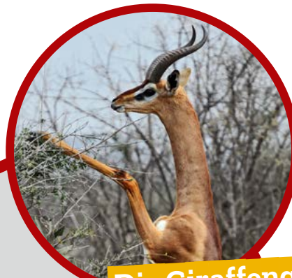
Die Giraffengazelle als Vorbild